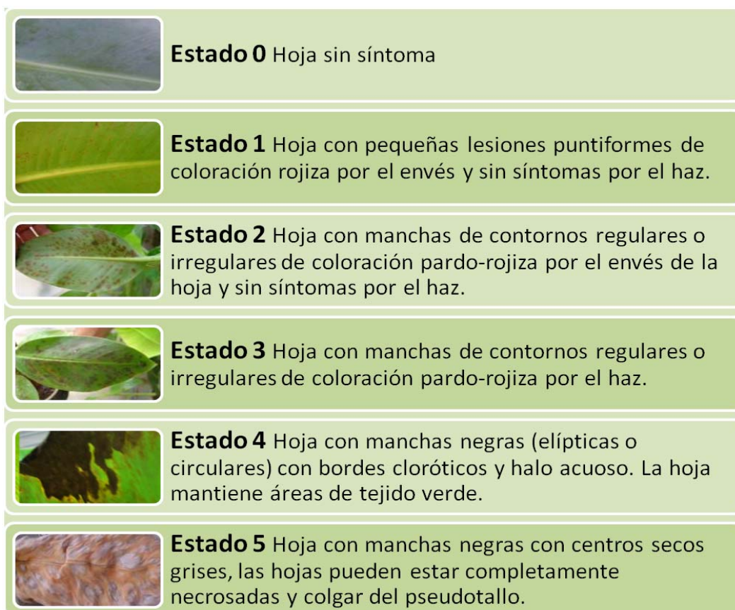
Figura 2. Escala descriptiva para la evaluación del desarrollo de los síntomas en hojas de Musa spp. inoculadas con M. fijiensis Morelet (Alvarado-Capó et al. , 2003).

Período de generación de las estructuras asexuales. Tiempo que media entre la fecha de la inoculación y la producción de los primeros conidios en las hojas enfermas (días). Sugerimos comenzar a evaluar dicha variable a partir del estadio 3 y 4 (Figura 2). Observar el envés de las hojas preferiblemente.