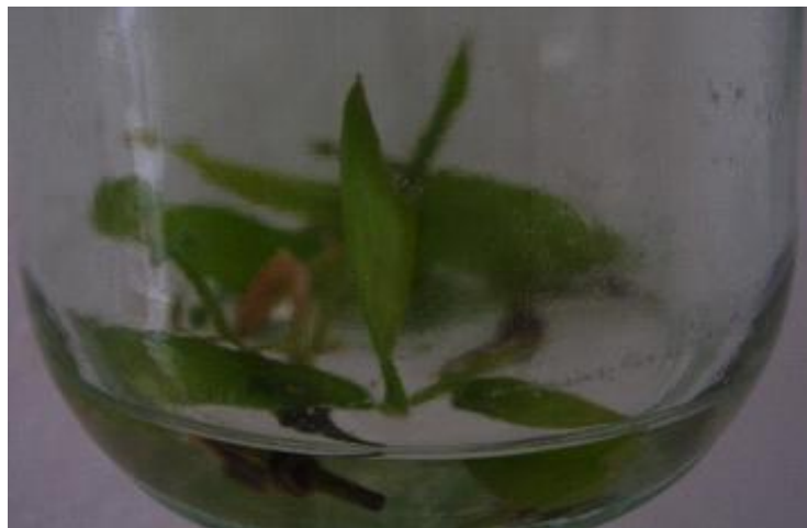
Figura 1. Plantas en grupo de a tres de Gigantochloa atter en el cuarto subcultivo de multiplicación.

Posteriormente, las plantas in vitro con una altura entre 5.0-6.0 cm fueron transferidas a fase de aclimatación. El medio de cultivo se retiró, las plantas se individualizaron y se lavaron con agua destilada. Según su tratamiento se plantaron en bolsas de polietileno negro (5 cm x 10 cm), las cuales contenían un sustrato integrado por compost de cachaza descompuesta y zeolita en proporción 4:1. En la casa de cultivo se redujo la intensidad luminosa mediante una malla de sombreo. Se utilizó un sistema de riego automatizado por microaspersión para evitar los daños por desecación. La frecuencia de riego fue de 2 min de duración cada 20 minutos durante las dos primeras semanas de cultivo, a partir de la tercera semana la frecuencia se incrementó a 40 min. Durante el periodo experimental la temperatura media diaria fue de 30 ± 2 °C y la humedad relativa del 70%.