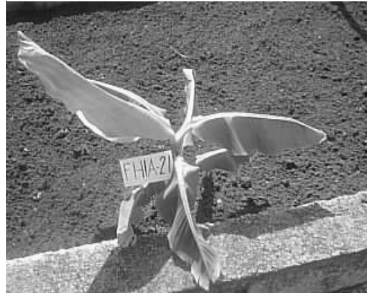
Fig 2. Vitroplanta de FHIA-21 original en cantero.