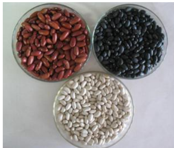
Figura 1. Semillas de tres cultivares de Phaseolus vulgaris L. empleadas en el estudio. Arriba izquierda: 'Delicias-364', arriba a la derecha: 'BAT-304', abajo: 'BAT-482'.

El contenido de compuestos fenólicos totales se determinó según procedimiento descrito por Bray y Thorpe (1954). Se pesó 1g de testa de las semillas para cada cultivar y se extrajo en 10 ml de etanol al 80% (v/v) durante 72 horas a 4 °C. Pasado este tiempo las muestras se calentaron a 50 °C, por 30 min. El extracto se centrifugó a 8 000 g por 10 min. Se tomó una alícuota de 1 ml del sobrenadante y se enrasó hasta 3 ml con agua destilada, se agregó 1 ml del reactivo de Folin Ciocalteau (Merck) y 2 ml de carbonato de sodio al 20% (m/v). Las muestras se calentaron durante 1 min en baño de agua hirviendo y posteriormente se enfriaron en agua corriente. La solución se diluyó hasta 10 ml con agua destilada y la densidad del color azul se midió a 750 nm en espectrofotómetro (Genesys 6, Thermo Electron Corporation, USA) contra el blanco (1ml de etanol al 80% en lugar del extracto y se siguió todo el procedimiento descrito anteriormente).