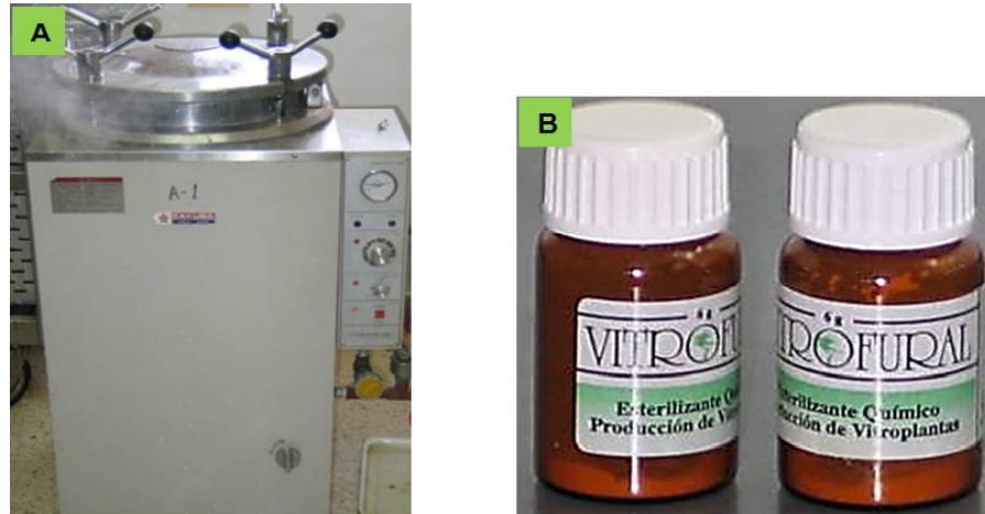
Figura 1. Autoclave (2A) y frasco de Vitrofur® (2B) utilizados para la esterilización de los medios de cultivo en la propagación in vitro de caña de azúcar en Biorreactores de Inmersión Temporal.

En las fases de multiplicación y crecimiento de los brotes de caña de azúcar en el BIT, se utilizó el protocolo propuesto por Lorenzo et al. (1998). El medio de cultivo utilizado fue el de Murashige y Skoog (1962) (MS), con 0.3 mg l -1 de Benciladenina (BA) y 1 mg l -1 de Paclobutrazol (PBZ). La duración de la fase de multiplicación fue de 28 días. La fase de crecimiento de los brotes se realizó en el mismo BIT sólo que se cambió el frasco de medio de cultivo por otro con la misma composición del medio de cultivo MS, con 1 mg l -1 de Ácido Giberélico (AG 3 ). La duración de esta fase fue de 15 días.