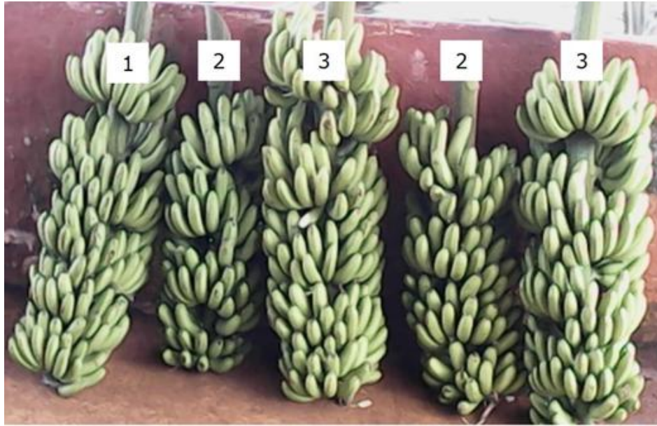
Figura 3. Racimos de plantas de Musa spp. 1. 'FHIA-17' (AAAA) obtenidas por propagación agámica, 2. 'Grande naine' (AAA) micropropagación, 3. 'FHIA-17' (AAAA) micropropagación.